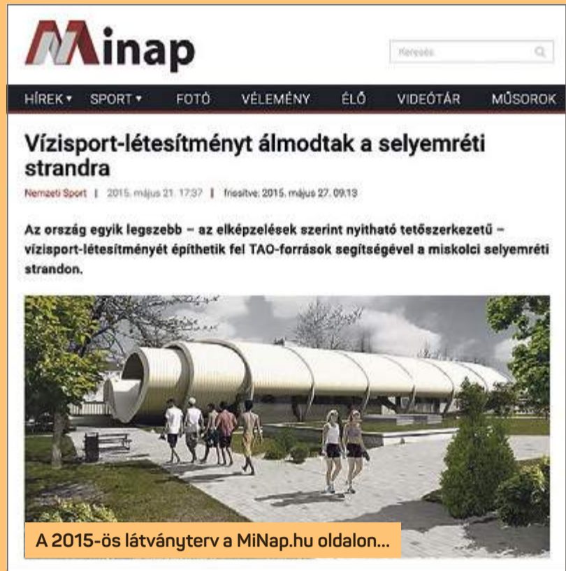
A 2015-ös látványterv a MiNap.hu oldalon...