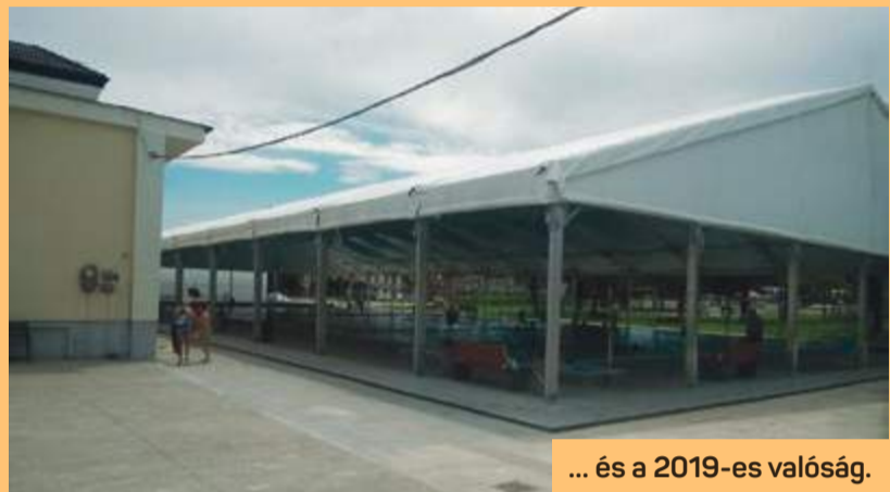
... és a 2019-es valóság.